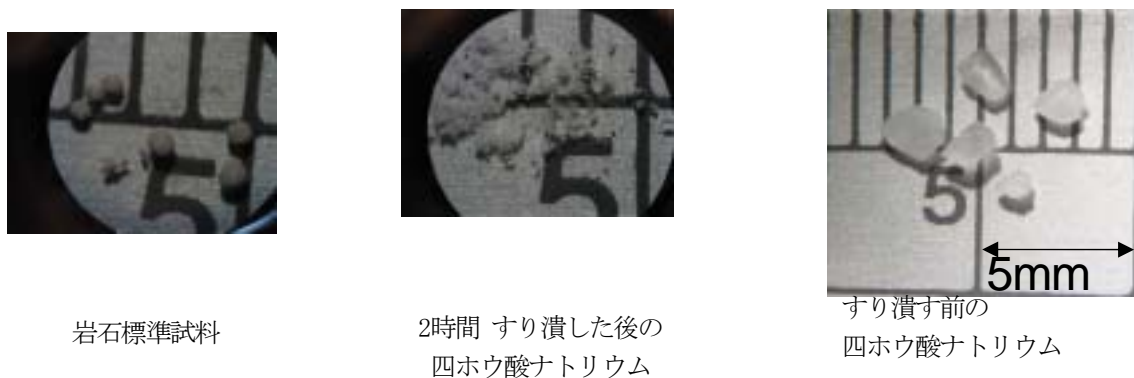
図1 岩石標準試料および融剤四ほう酸ナトリウムの顕微鏡写真

前処理としてガラスビードを作成した。作製法は次の通りである。融解皿に、産業技術総合研究所頒布の岩石標準試料 JLK-1 を 0.3 g を量り取り、融解剤として四ほう酸ナトリウム 5g を加えてよく攪拌する。融解剤はあらかじめよくすり潰しておく。試料と融解剤が均一になるよう良く攪拌する。融解皿をバーナーにて強熱し、融解剤が流動状態になり、融成物が均一になっている事を確認したら、室温まで放冷する。融解皿からガラスビードを取り出す。ガラスビードが均一に作成され、ヒビや気泡がない事を確認して、蛍光X線分析装置により測定を行った。前処理なしの粉体状態の試料は試料ホルダーにいれ、そのまま測定を行い、これらの結果を比較した