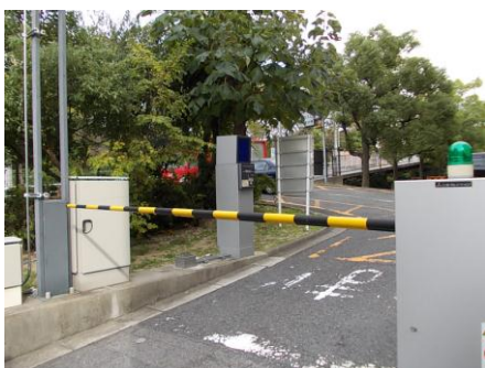
図 3.3 8・9 号館出入口ゲート