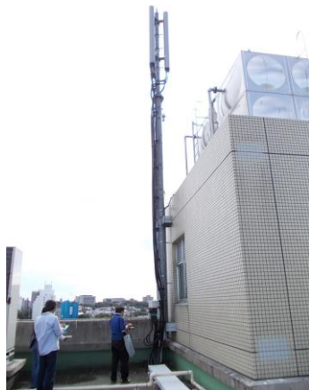
図 3.4 9 号館屋上携帯電話アンテナ