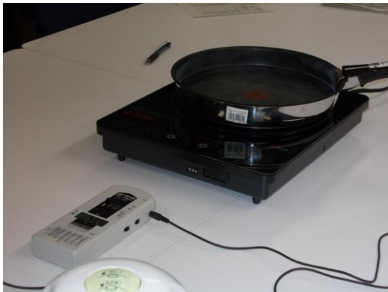
図 3.6 EIH-14