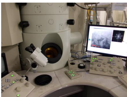
図 3.2 超高压電子顕微鏡施設

測定結果は表 3.2～3.4 に示す。測定結果を表 2 の各国の電磁波のガイドライン規制値と照らし合わせてみると測定データは、安全であるといえる。