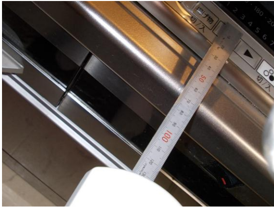
図 3.5 CH-CST6IH