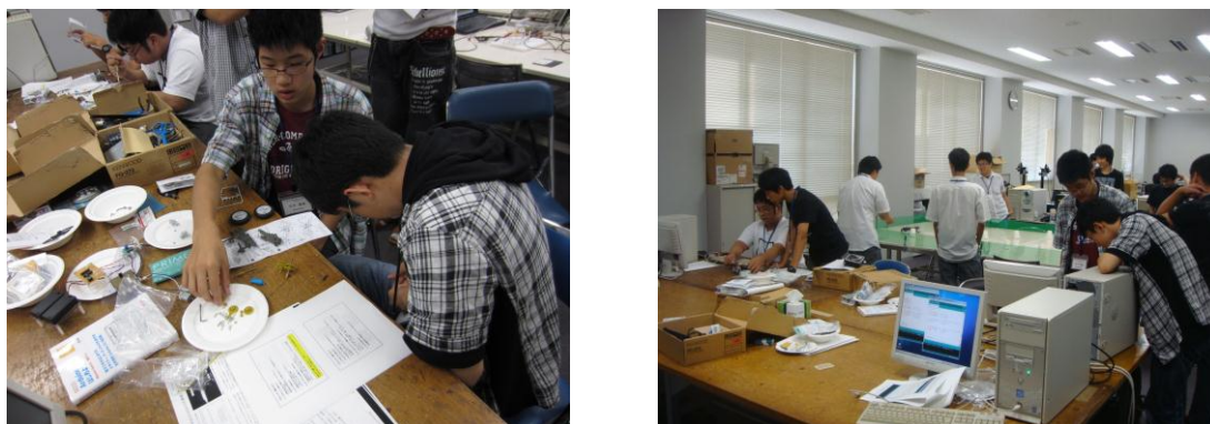
図2. 「リモコンカーを作る ～メカトロニクスとプログラミング入門～」の実験風景

ってもらふことを目的としている。本年度は6テーマの実験があるうちの1テーマに「リモコンカーを作る ～メカトロニクスとプログラミング入門～」(図2.)を企画・立案し実施まで行なった。