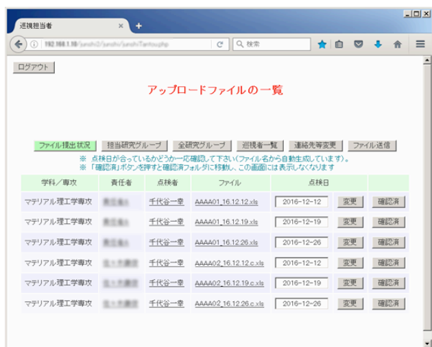
図 5. 点検票確認後の一覧

そして一覧の右側にある「確認済」ボタンを押すことで、衛生管理者による点検票の確認が行われたことがデータベースに登録され、この一覧表には表示されなくなる（図 5）。同時に一時的に点検票が集約されているディレクトリから研究室ごとのディレクトリ内にそれぞれ点検票の移動が行われ、必要な期間保管される。この保管された点検票は FTP によってダウンロードすることができる。