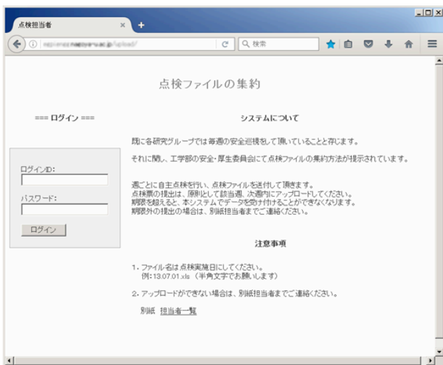
図 1. 集約システムへのログイン画面

点検票回収のため研究室、事務室など管理対象ごとに ID を設定してあり、提出する点検票のファイル名には点検日を使用することになっている。集約システムには WEB ブラウザを利用して図 1 のようなログイン画面からアクセスし、図 2 のファイル選択・送信画面から点検票を提出する。提出された点検票は最近一ヶ月分が画面上に表示されており、ファイル名が点検日であるため各週の提出状況がわかるようになっている。