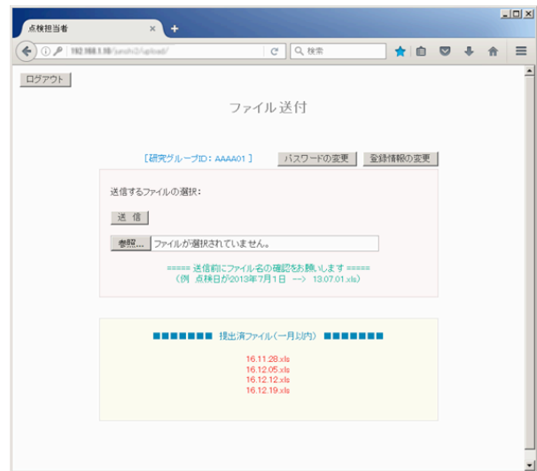
図 2. ファイル選択・送信画面